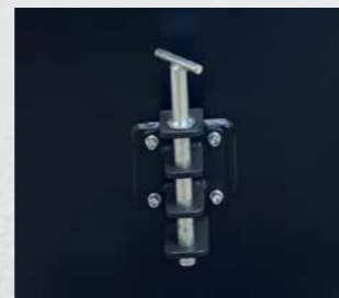
Pino de Engate Traseiro de Múltipla Posições