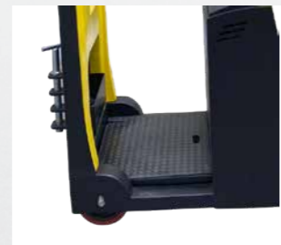
Assoalho Espaçoso, Anti-Derrapante