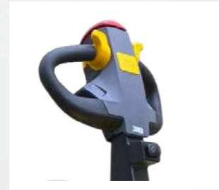
Timão Ajustável, Ergonômico