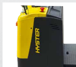
Fácil Acesso para Manutenção via Tampa Dianteira