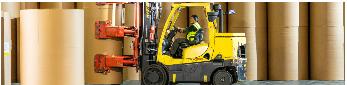
Il carrello illustrato è disponibile come modello Hyster S7.0FT nell'area EMEA.

Sulla base delle esperienze di successo avute in passato con Hyster per realizzare una flotta di carrelli elevatori "su misura" per l'attività da svolgere, Seaonus si è rivolta a Hyster e al suo concessionario locale, Briggs Equipment, per fare lo stesso per il proprio magazzino. Hyster ha lavorato a stretto contatto con Briggs Equipment e Bolzoni, da lunga data il fornitore di attrezzature per Seaonus, per valutare attentamente l'attività e consigliare le attrezzature più appropriate con miglioramenti specifici per tale applicazione.