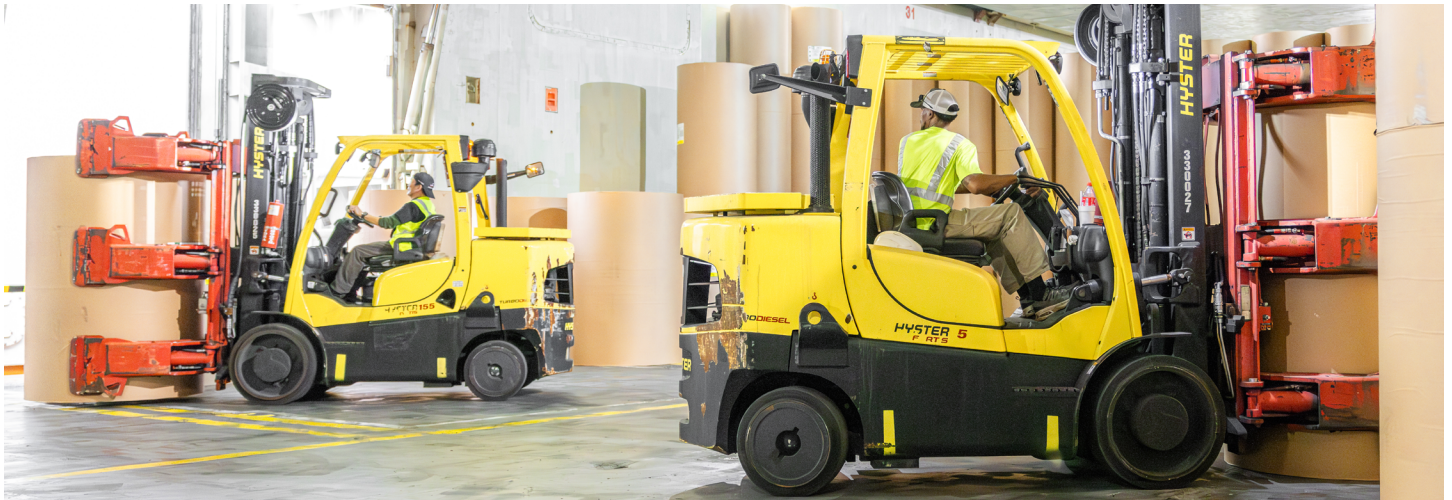
Il carrello illustrato è disponibile come modello Hyster S7.0FT nell'area EMEA.

Il team ha consigliato di sostituire l'attuale flotta di carrelli elevatori di grande portata utilizzati nel magazzino con i carrelli di grande portata Hyster®, con portate di 23.000 e 36.000 libbre (10 e 16 tonnellate) e un'ampia gamma di attrezzature Bolzoni per la movimentazione della carta. Il team ha inoltre consigliato speciali personalizzazioni tecniche, tra cui un telaio a passo corto per migliorare la manovrabilità, un montante con altezza di sollevamento speciale per ottimizzare lo stoccaggio nella struttura grazie all'accatastamento in altezza e miglioramenti a livello idraulico per agevolare il movimento fluido delle pinze per bobine di carta.