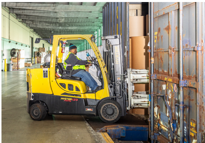
Il carrello illustrato è disponibile come modello Hyster S5.5FT nell'area EMEA.

Dopo un periodo di dimostrazione delle attrezzature di grande portata e la conferma dei tempi di consegna competitivi, Seaonus ha effettuato un ordine dei carrelli. Le attrezzature sono state consegnate puntualmente e il team si è recato sul posto il giorno successivo per assemblare e installare i carrelli, eseguire test e far sì che gli operatori fossero operativi sui carrelli entro due giorni dalla consegna. I carrelli consentono al terminal Seaonus di movimentare i carichi all'interno del magazzino in modo più efficiente, migliorando il comfort